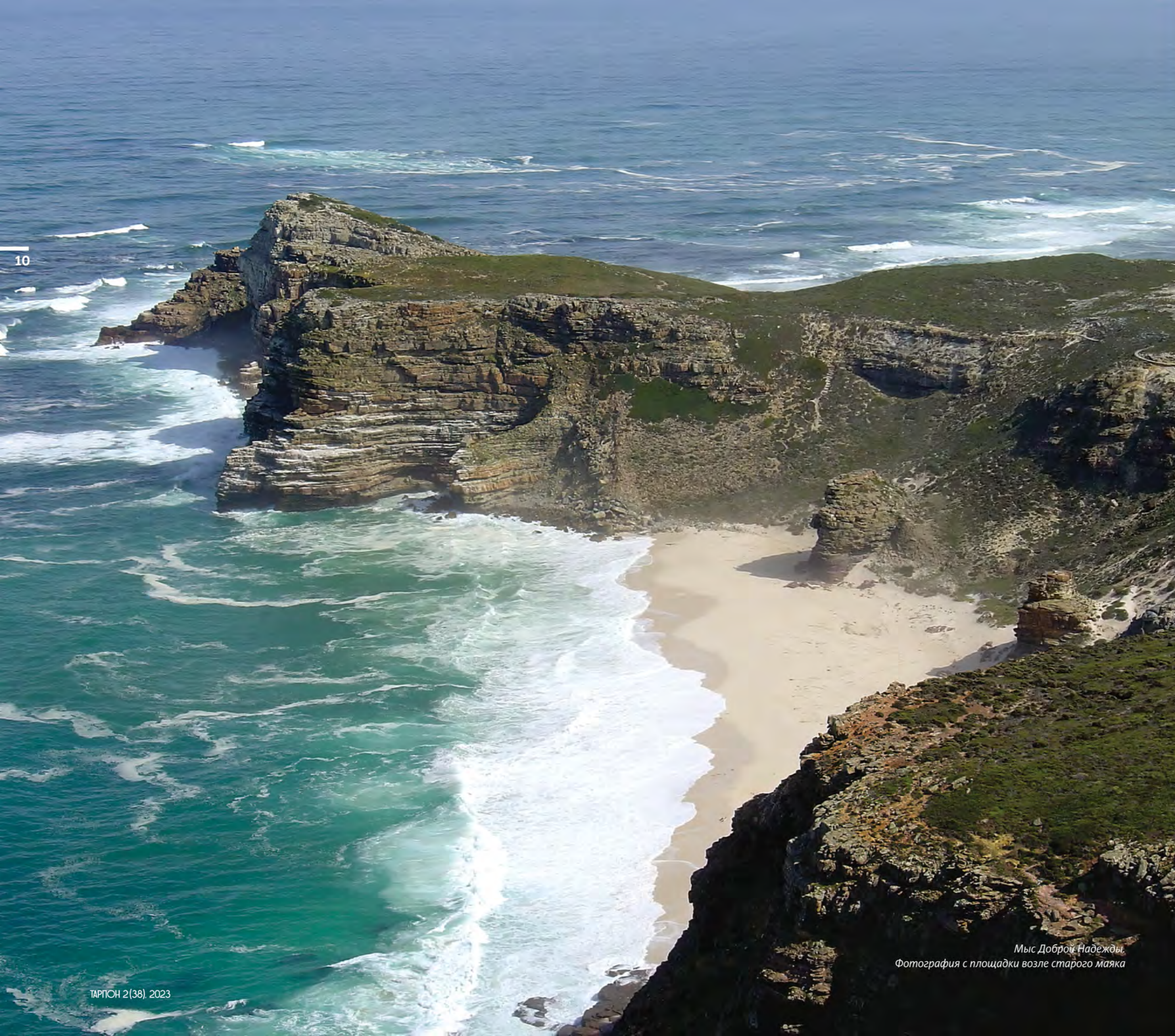
Мыс Доброй Надежды. Фотография с площадки возле старого маяка