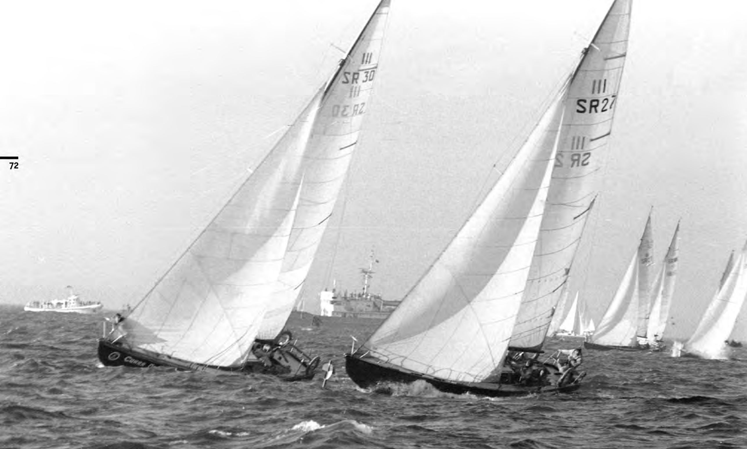
Старт этапа гонки на Кубок Балтики, 1978 г.