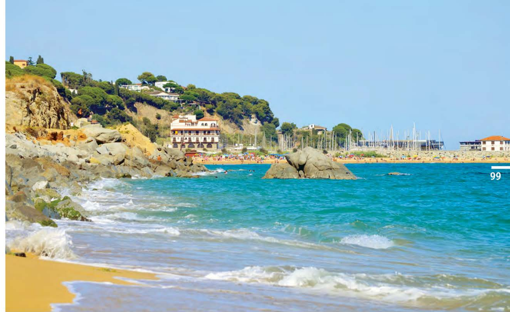
Город Аренсьс-де-Мар — столица рыбаков провинции Барселона

Одним из старейших и наиболее известных в мире экс-вото в виде модели судна морские историки считают так называемое «судно из Матаро». Модель находится в морском музее Роттердама. А нашли ее в развалинах местного монастыря.