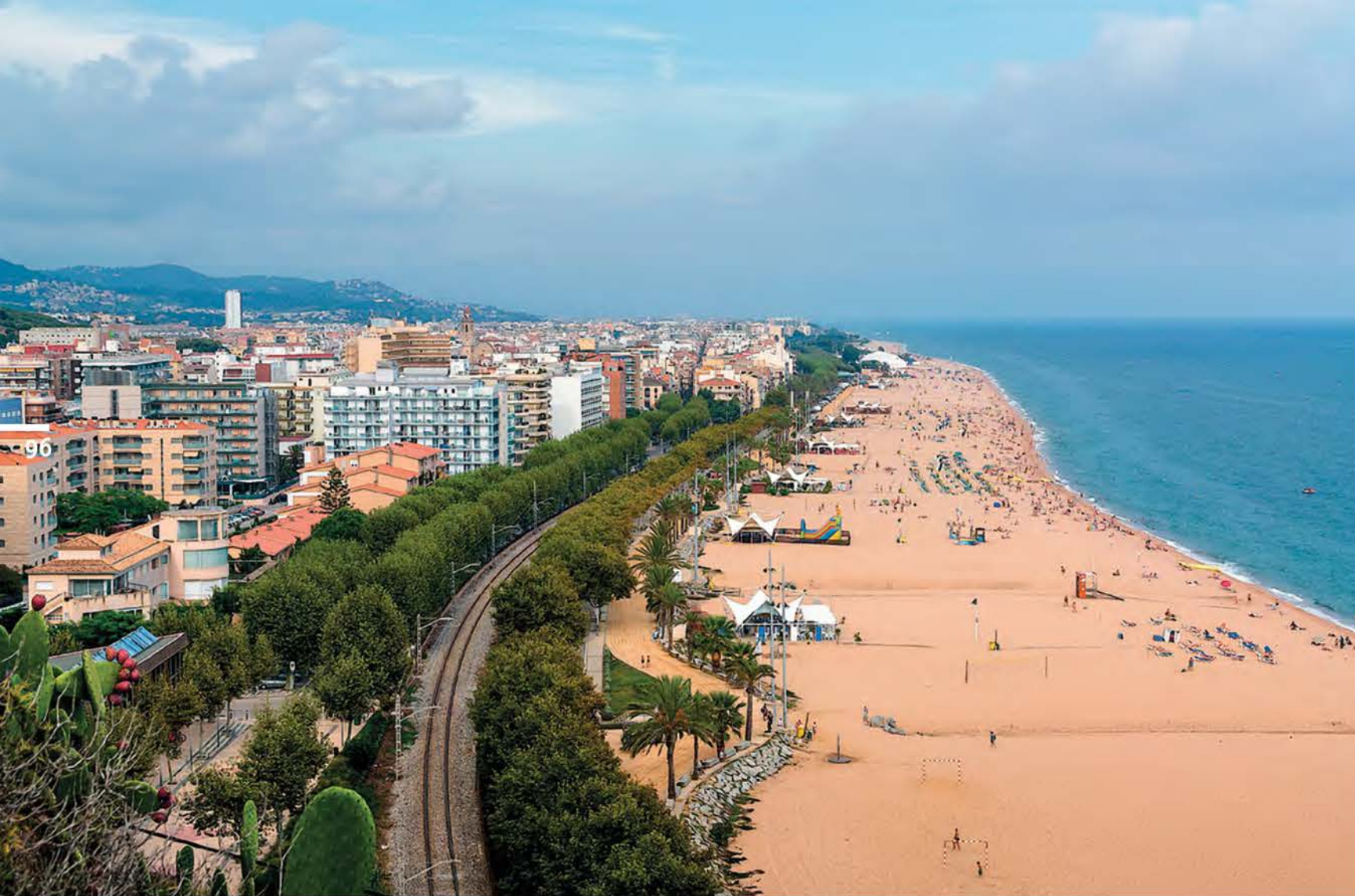
Коста-дель-Маресме — это длинные набережные, утопающие в цветах, и многокилометровые песчаные пляжи