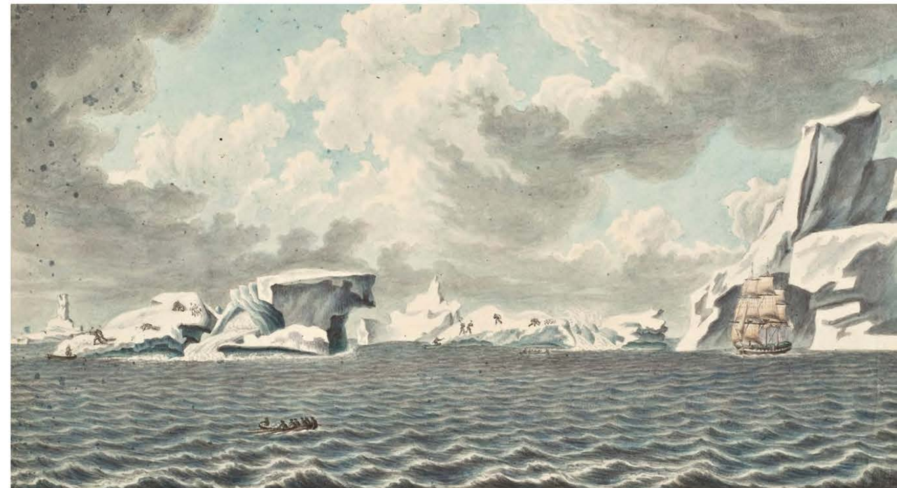
«Вид ледяных островов, 8 января 1820 г.»

Капитаны русских кораблей и сопровождавший их художник были милостиво удостоены приема королевской четой. Безусловно, такое значимое событие не могло ускользнуть от всегда вооруженного кистью Михайлова. Художник создал замечательные по этнографической точности портретные рисунки короля и королевы Таити.