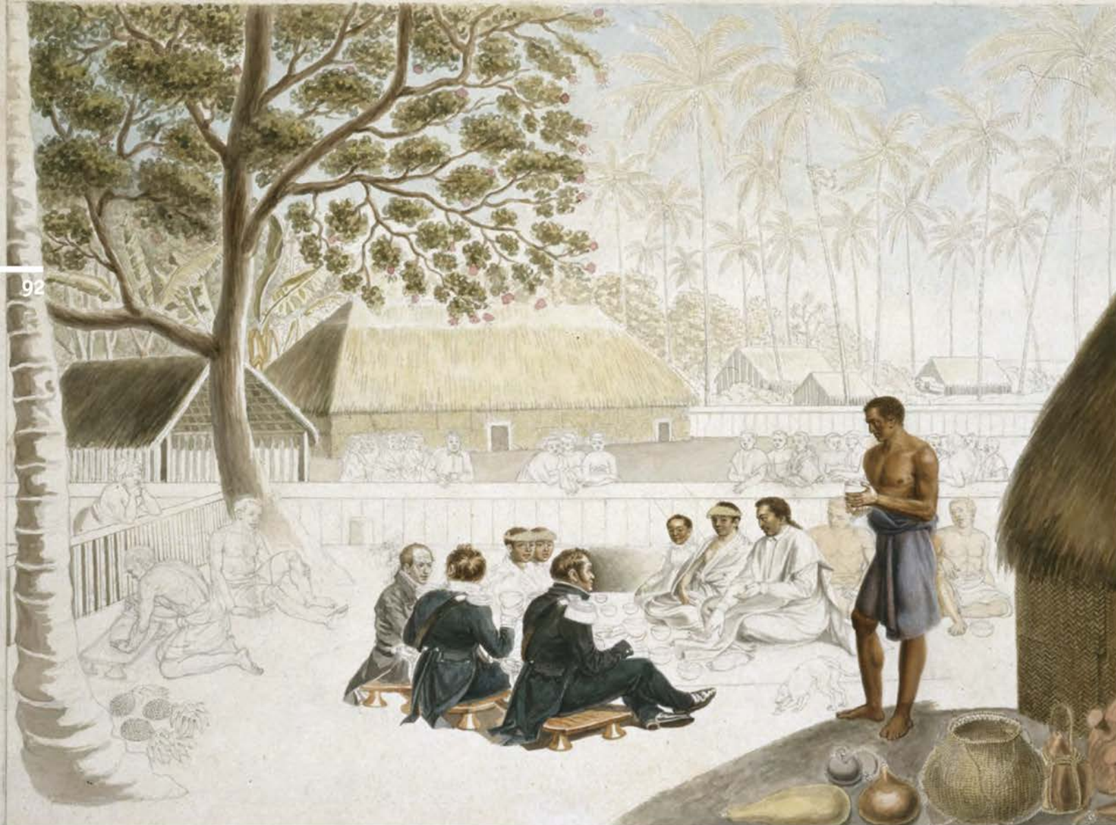
«Ф. Ф. Беллинсгаузен, М. П. Лазарев и П. Н. Михайлов на завтраке у Таитского короля». Эскиз. 1820 г.

Экспедиция обнаружила еще ряд островов, один из которых был назван в честь нашего героя — островом Михайлова. И вот вновь Порт-Джексон, ремонт рангоута, закупка провизии — и дальше в путь.