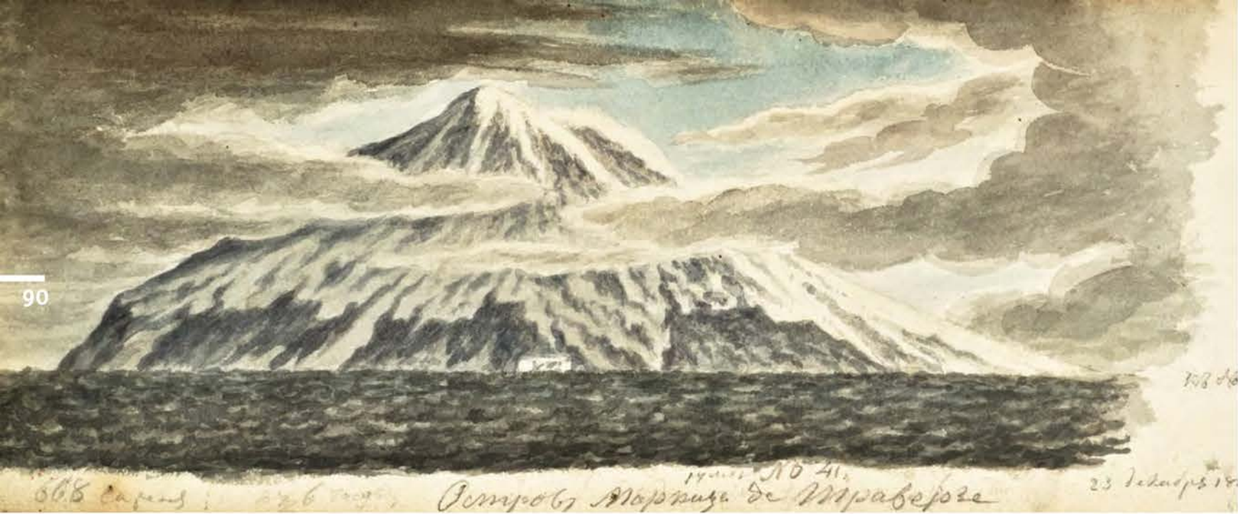
«Остров Высокий, ранее — Торсена (о-ва Маркиза де Траверсе), 23 декабря 1819 г.»

Со входом в антарктические воды изобразительный язык Михайлова сильно изменился: на смену подробной детализации, которой отличались его предыдущие рисунки, пришел лаконизм, четкие отрывистые линии. Возможно, сама арктическая природа направила мастера, но, скорее всего, новую художественную манеру продиктовал суровый климат: работать на холоде акварельными красками чрезвычайно трудно.