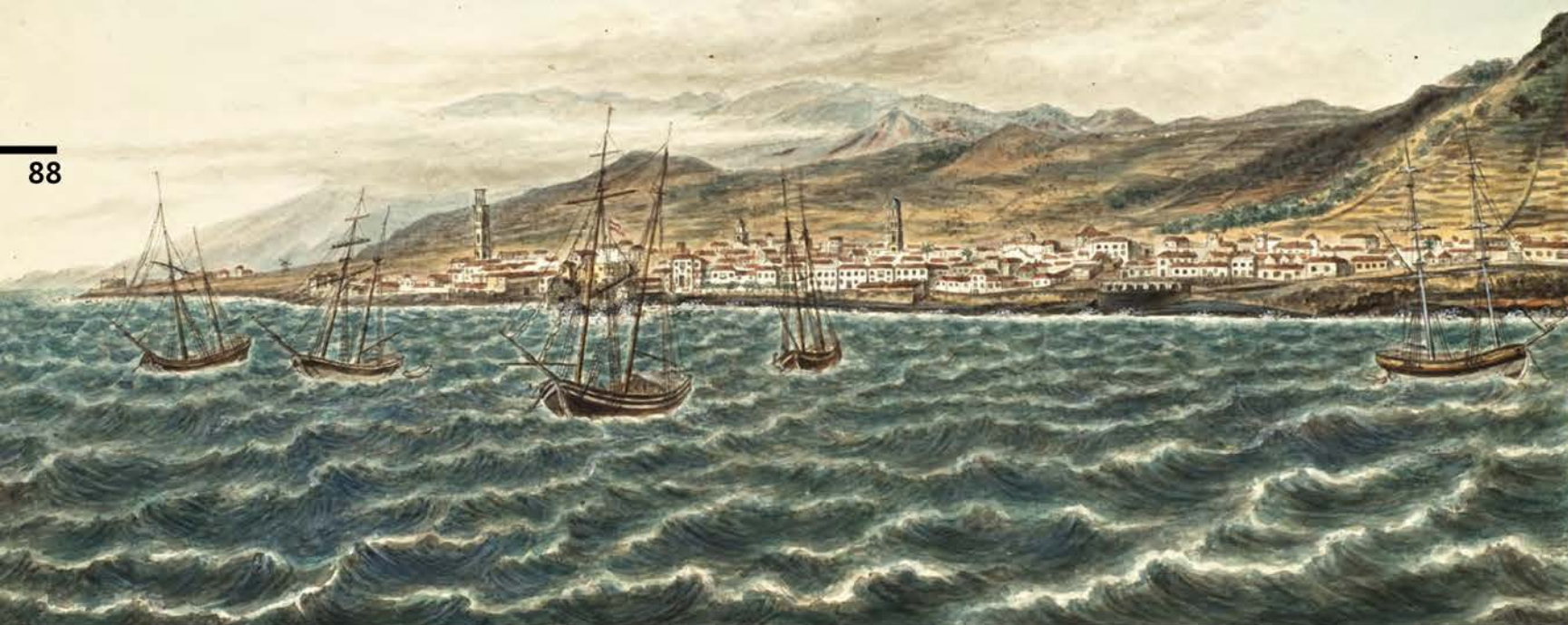
«Вид порта Санта-Крус на острове Тенерифе, 17 сентября 1819 г.»

О самой экспедиции написано достаточно много, поэтому попробуем взглянуть на нее в этот раз глазами художника.