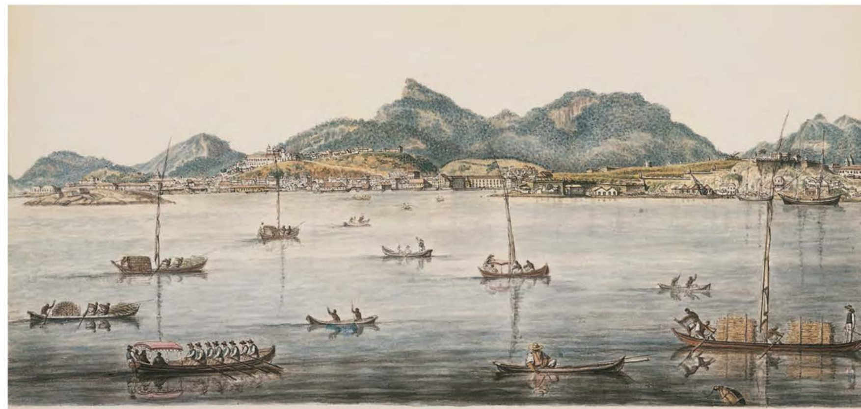
«Вид города Сан-Себастьян в заливе Рио-де-Жанейро», 1819

Видов местных окрестностей было создано художником довольно много. Объяснением этому является продолжительная стоянка шлюпов у этих берегов, позволившая членам экспедиции подробнее ознакомиться с новыми для них землями. Важно отметить, что пребывание русских путешественников в Бразилии было столь длительным благодаря участию российского консула Г. И. Лангсдорфа — доброго товарища Ф. Ф. Беллинсгаузена по первому кругосветному плаванию под началом И. Ф. Крузенштерна.