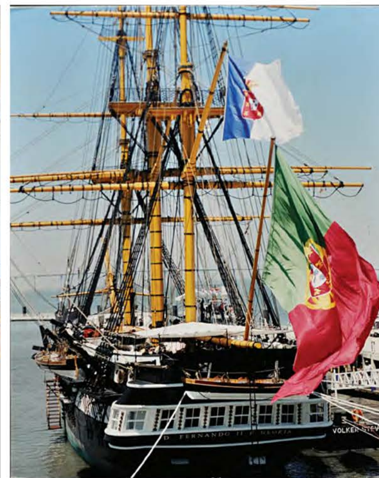
Фрегат на выставке Expo 98. Над ним развеваются два португальских флага: современный красно-зеленый и «монархический» бело-синий, под которым парусник ходил до 1910 г.