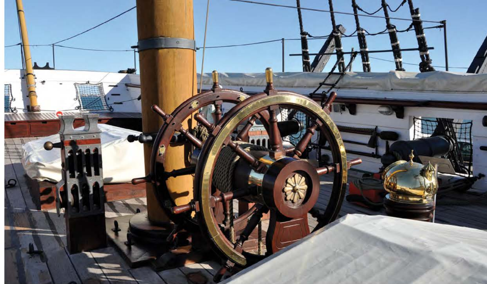
Штурвал у бизань-мачты. Справа виден начищенный до блеска латунный нактоуз компаса

«Дон Фернанду II э Глория» сделал несколько походов по Индийскому маршруту. В 1852 г. он совершил рейс на о. Мадейра, доставив туда нуждавшуюся в лечении принцессу Марию Амелию Бразильскую. А в 1854 г. на борту фрегата в Анголу прибыла экспедиция путешественника Антониу да Сильва Порту, которой предстояло пересечь Африку с запада на восток и выйти к Индийскому океану в Мозамбике. В 1855 и 1860 гг. фрегат принимал участие в действиях против повстанцев в африканских колониях — перевозил войска, а также лошадей и овец из Южной Африки в Анголу.