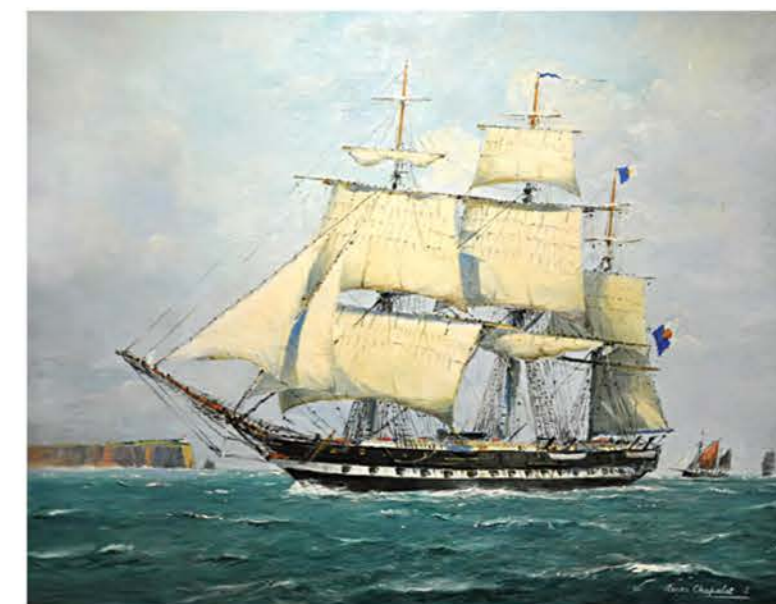
Фрегат «Дон Фернанду II э Глория» под парусами. Картина из экспозиции Морского музея в Лиссабоне

Ныне популярный курорт Гоа на западном берегу п-ва Индостан на протяжении многих веков принадлежал Португалии. Благодаря наличию поблизости прекрасного кораблестроительного материала — индийского тика — в Гоа были созданы верфи, где под руководством европейских инженеров сооружали весьма совершенные корабли, по долговечности не имевшие себе равных. (Между прочим, доживший до наших дней английский 44-пушечный фрегат «Тринкомали» тоже был построен в Индии: его спустили на воду в Бомбее в 1817 г.)