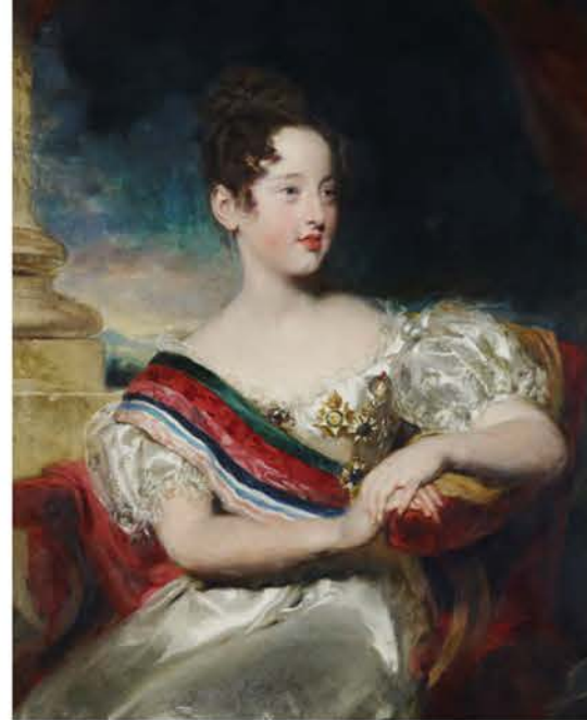
Королева Португалии Мария II и ее муж Фердинанд II