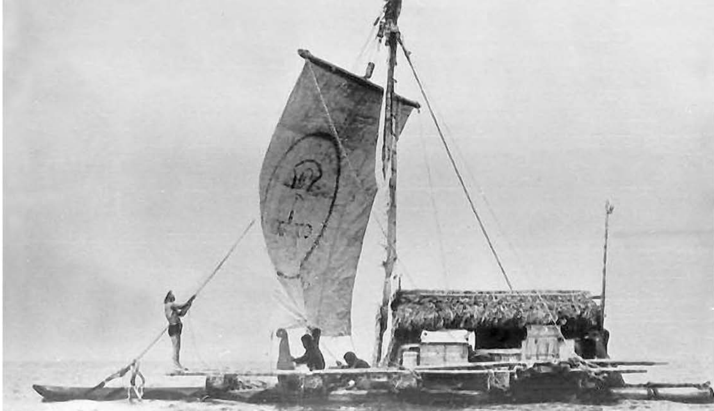
На борту плота «Ла Пасифика»

Удача улыбнулась путешественникам. Переход от Гуаякиля до австралийской Мулулабы длился 160 дней — на два месяца больше, чем плавание «Кон-Тики». Мореходы преодолели 8600 миль, а затем плот отправился в сухопутное путешествие по Австралии: его показывали всем желающим в Брисбене, Сиднее, Мельбурне и Аделаиде, затем разобрали и отвезли в Испанию.