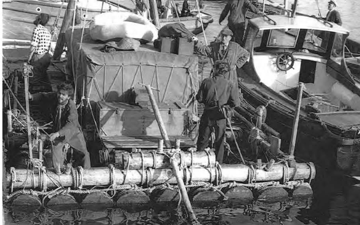
«Атлантический» плот Боду