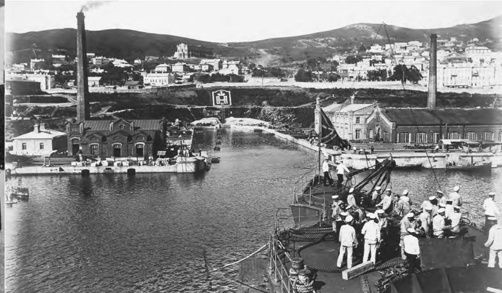
Владивосток. Ввод крейсера «Богатырь» в док. Сентябрь 1904 г.