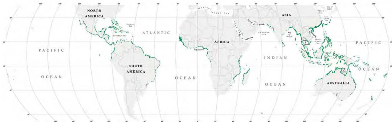
Ареал распространения мангровых лесов

множество животных, птиц и насекомых. Растения не только дают пищу многим подводным обитателям, но и увеличивают за счет многочисленных корней придонную поверхность, поэтому «население» тут велико: моллюски, членистоногие, различные черви, ракообразные... Специфические условия привели даже к появлению таких животных, которых можно увидеть только здесь. К ним смело можно отнести илистого прыгуна — рыбу, которая немалое время проводит на суше! Дышит она не только с помощью жабр, но может усваивать кислород и прямо из воздуха, через кожу. Благодаря особенностям строения грудных плавников прыгуны передвигаются по суше прыжками, забираются вверх по веткам и удерживаются на почти вертикальных поверхностях с помощью брюшной присоски! Многие виды рыб размножаются в мангровых зарослях.