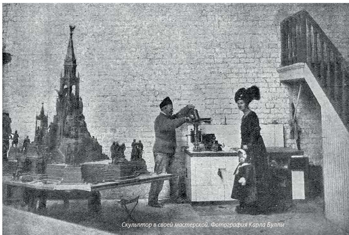
Скульптор в своей мастерской. Фотография Карла Буллы