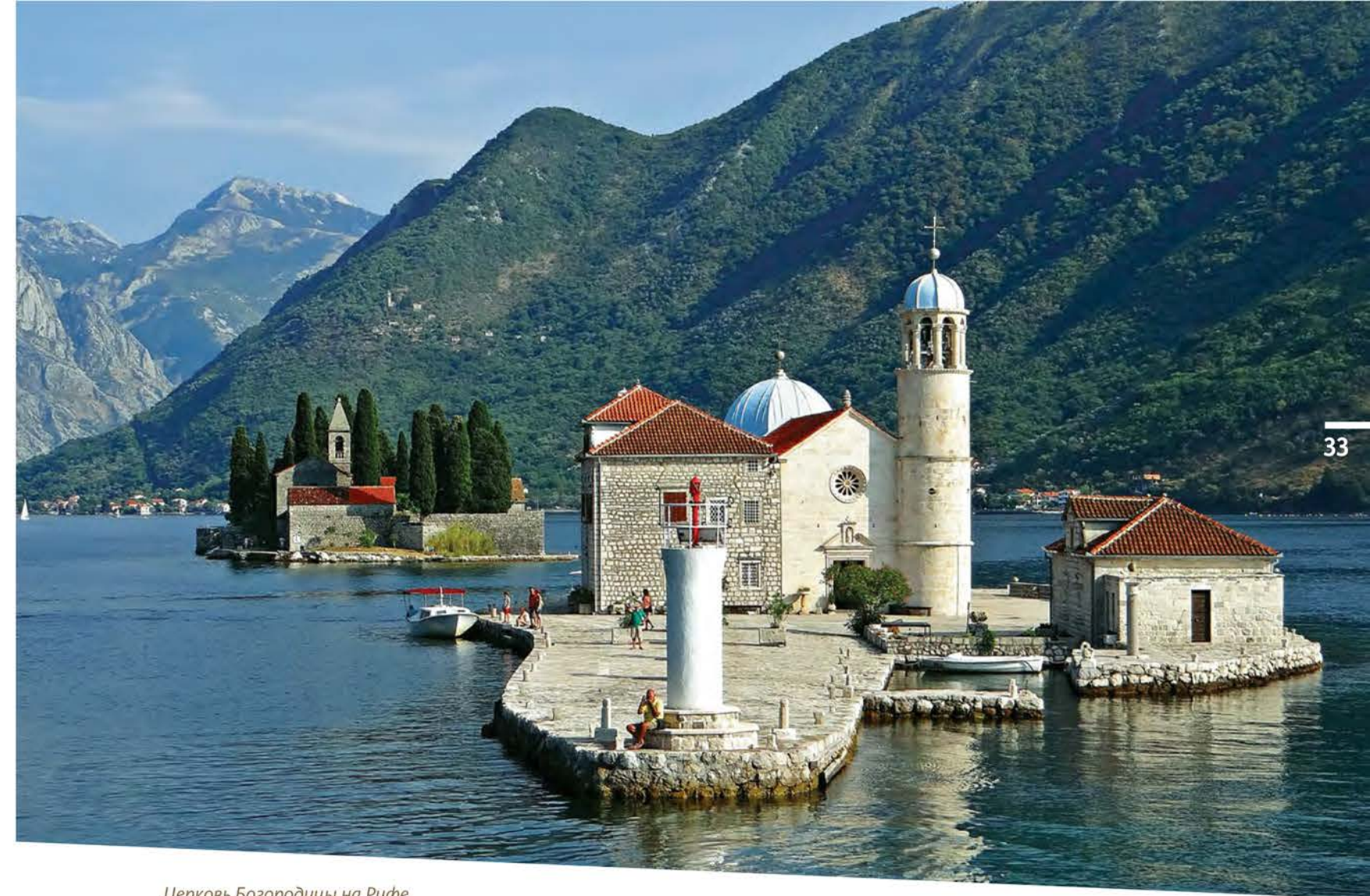
Церковь Богородицы на Рифе