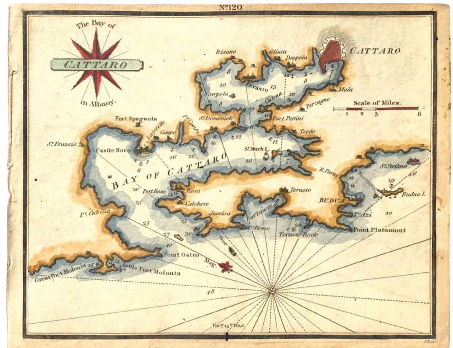
Английская навигационная карта Которского залива. 1802 г.

Начало русским визитам в Черногорию положил известный бонвиван, успешный посол всех русских дипломатических миссий в Европе петровской эпохи Петр Андреевич Толстой, тонкий знаток придворной интриги, который окончил свой жизненный путь в духовной твердыне Беломорья — Соловецком монастыре. Но не монахом, а узником. Ему было уже за восемьдесят, когда блистательная дипломатическая карьера вдруг оборвалась в камере — в каменном мешке, где даже некому было рассказать о своей долгой и интересной жизни. В том числе и о посещении Черногории в 1697 г.,