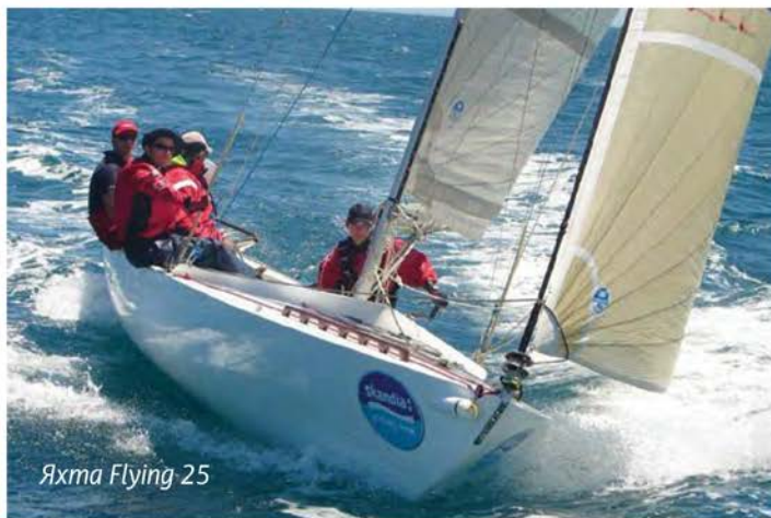
Яхта Flying 25

В 1970 г. Фокс перенес инфаркт, после которого перестал участвовать в гонках. Два года спустя его не стало. Проводить друга в последний путь пришел и принц Филипп. Он же написал предисловие к биографии Фокса, вышедшей шесть лет спустя. В нем он дал своему другу такую характеристику: «Всею своею жизнью он проповедовал свободу человеческого духа, сражаясь с глупостью, тупостью и самоуверенностью. Веселая легкость, с которой он делал это, обезоруживала практически каждого».