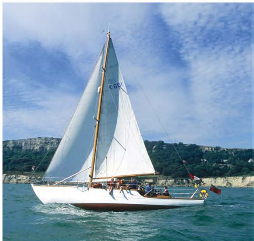
Яхта «Huff of Arklow», созданная Уффой Фоксом в 1951 г., была одним из первых шлюпов с топовым вооружением и первой яхтой, предназначенной для движения в океане в режиме глиссирования

У читателя может сложиться впечатление, будто Фокс занимался только маленькими гоночными яхтами. Это не так: еще в 1930 г. он построил очень удачный шхерный крейсер «Vigilant» международного класса 22 кв. м, а в 1951 г. спроектировал килевую яхту «Huff of Arklow» класса The Flying 30. Проект вышел поистине революционным: «Huff of Arklow» был первой океанской гоночной яхтой, способной глиссировать. Руль располагался отдельно от киля, на скеге (в то время очень необычное решение для океанской яхты). В 1960 г. во время плавания