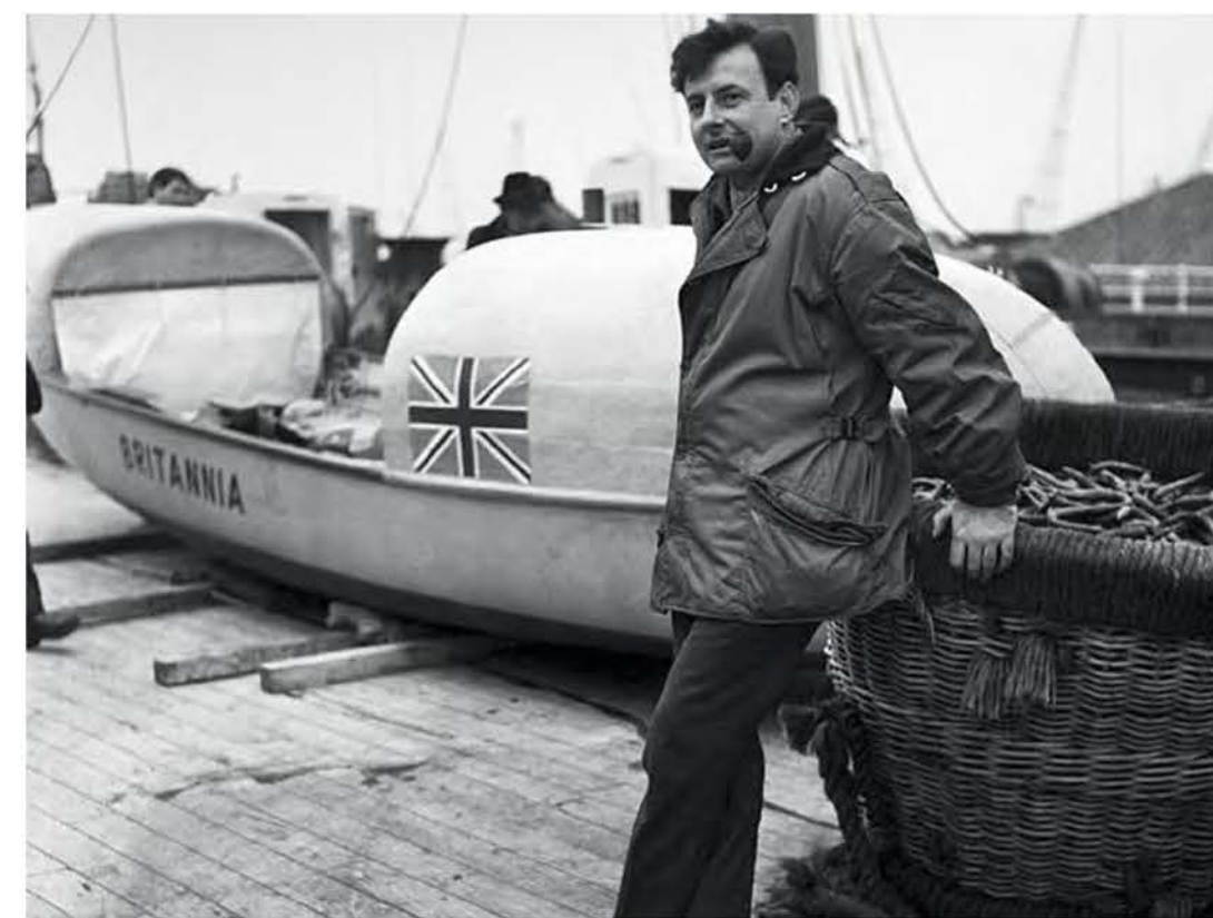
Спасательная шлюпка конструкции Уффы Фокса сохранила немало жизней во время Второй мировой войны

Невозможно в короткой статье рассказать обо всех проектах Уффы Фокса: их известно не менее пятидесяти. А еще он написал более десятка книг, посвященных судостроению и парусному спорту, и вдобавок неплохо рисовал. Да и гонщиком был отличным, хотя и, видимо, склонным к чрезмерно рискованным поступкам.