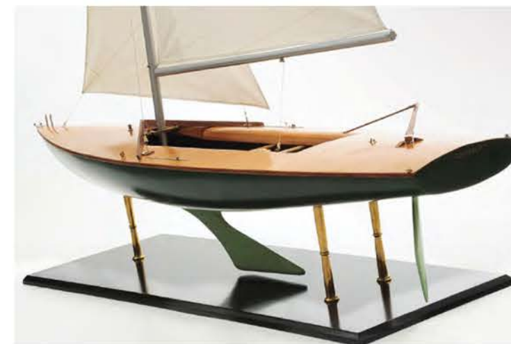
Модель яхты Flying Fifteen