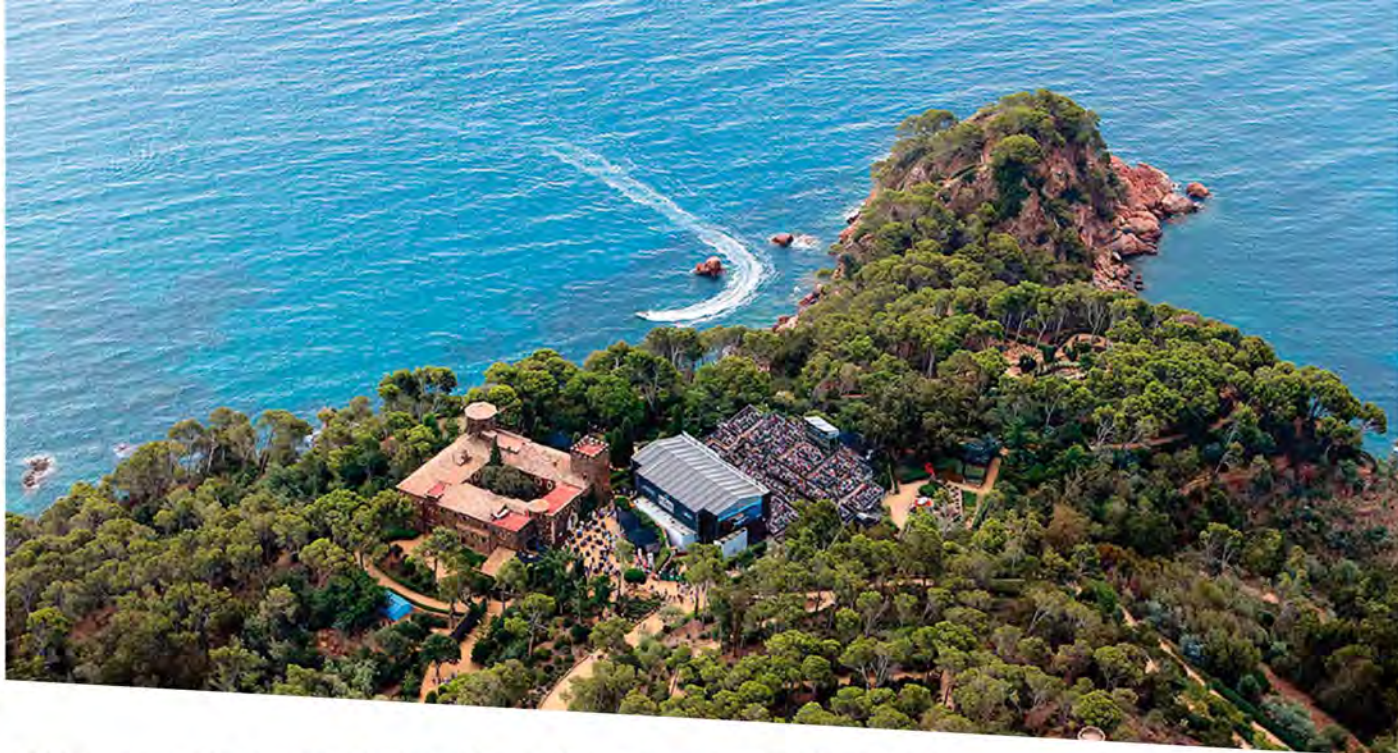
С 2001 г. в замке Кап-Роч ежегодно проводится один из крупнейших на Коста-Браве музыкальных фестивалей, участниками которого не раз становились звезды мирового уровня