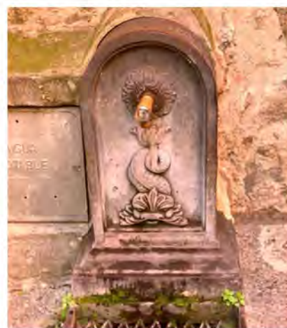
Паламос. Кран с питьевой водой