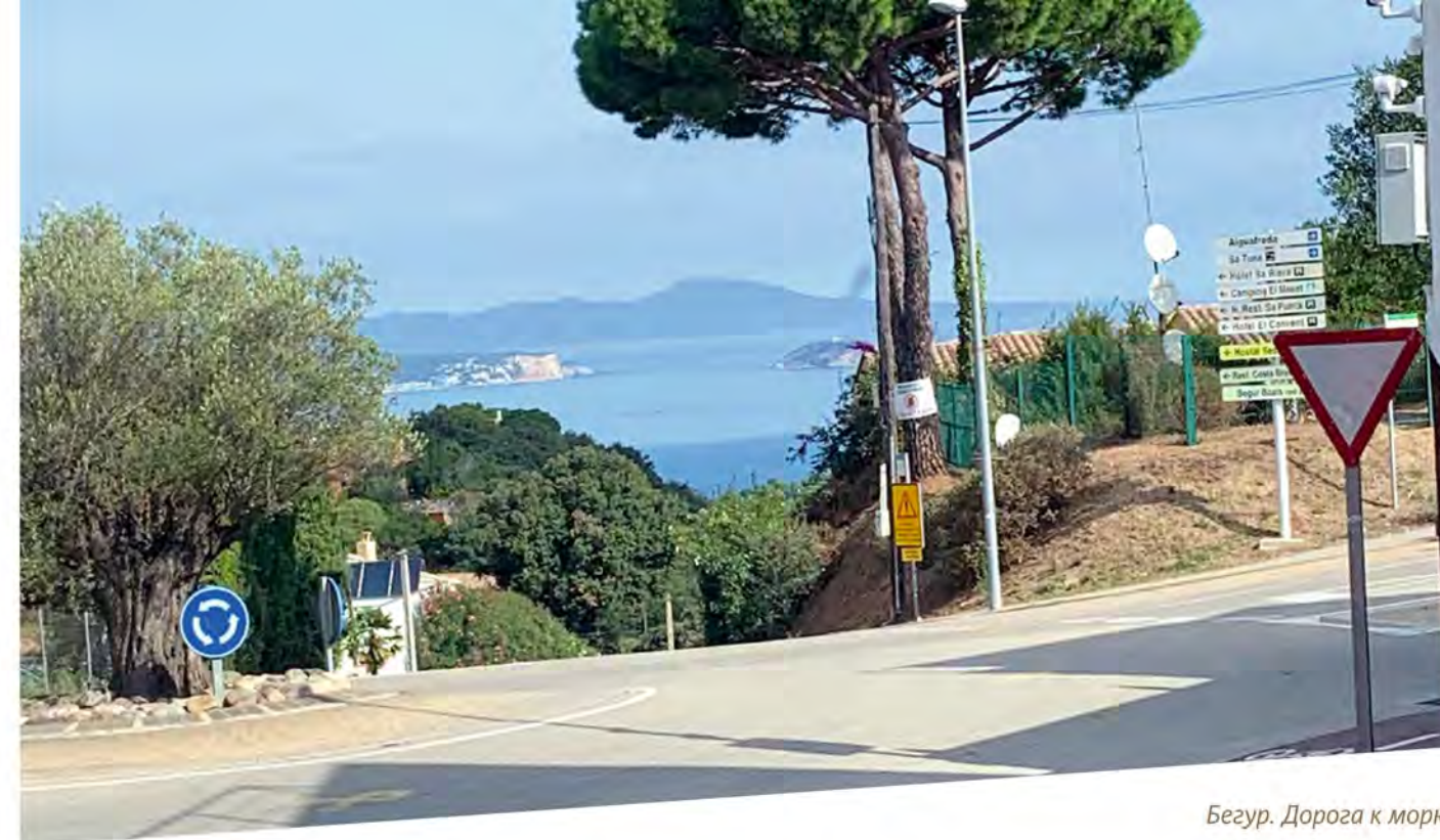
Бегур. Дорога к морю

Городок Бегур, расположенный в одном из самых красивых мест побережья, очень нравился индианос, вернувшимся с Больших Антильских о-вов. Туда, в основном на Кубу, в начале XIX в. уезжали ради заработ-