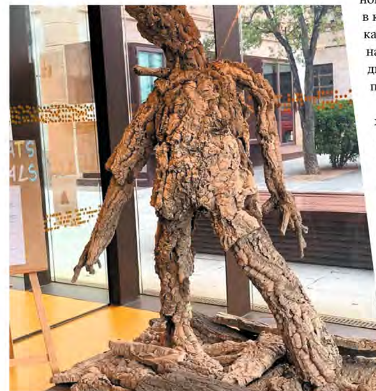
Палафружель. Человек из коры пробкового дерева на входе в Музей пробки

А вот трогательная история, связанная с Россией. В 20-х гг. прошлого века Палафружель понравился русскому эмигранту, бывшему военному летчику, герою Первой мировой войны