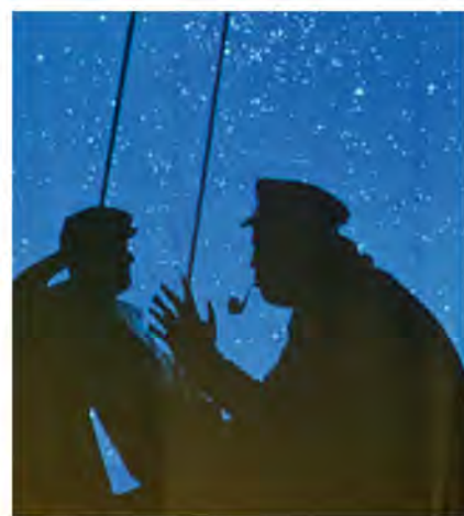
Льорет-де-Мар. Фрагмент инсталляции в Морском музее