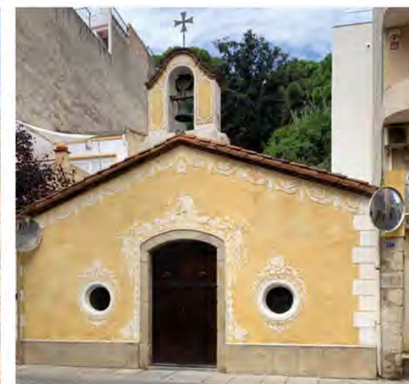
Бланес. Морская часовня, XVIII в.