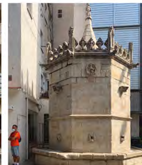
Бланес. Готический фонтан. XIV в.

щиеся их центрами, по-хорошему похожи: в каждом есть яхтенная гавань, а исторический центр окружен отелями, магазинами, ресторанами, центрами развлечений. И, что важно, города эти хорошеют: их исторические ценности берегут. В прошлом какие-то из них были простыми рыбацкими деревушками, какие-то — небольшими городами с церквями и обязательной крепостью. Перспектива времен иногда чудесным образом просматривается в узких улицах: вот тебе суровое Средневековье, вот барочные завитки, а вот и гаудианские отголоски.