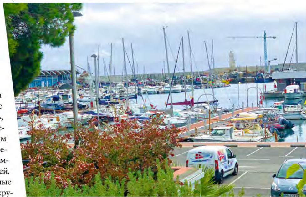
Бланес. Яхтенная стоянка

Горы и море — завораживающая особенность каталонского побережья. Оно условно разбито на четыре части. Южная — Коста-Дорада с ее тонким песком и детским гомоном, далее Коста-дель-Гарраф — рай для нудистов, потом Коста-дель-Маресме, вдоль которого проходит железная дорога, и, наконец, прекрасная Коста-Брава. Эта северная часть побережья начинается со старинного курорта Бланес и тянется к северу, доходя до французской границы. Еще в 50-е гг. Коста-Брава оправдывала свое название — «дикий берег»: неровное, изрезанное бухтами и лагунами побережье. Здесь есть бухты, к которым невозможно подобраться по суше. Во многих местах дно резко уходит вниз, буквально