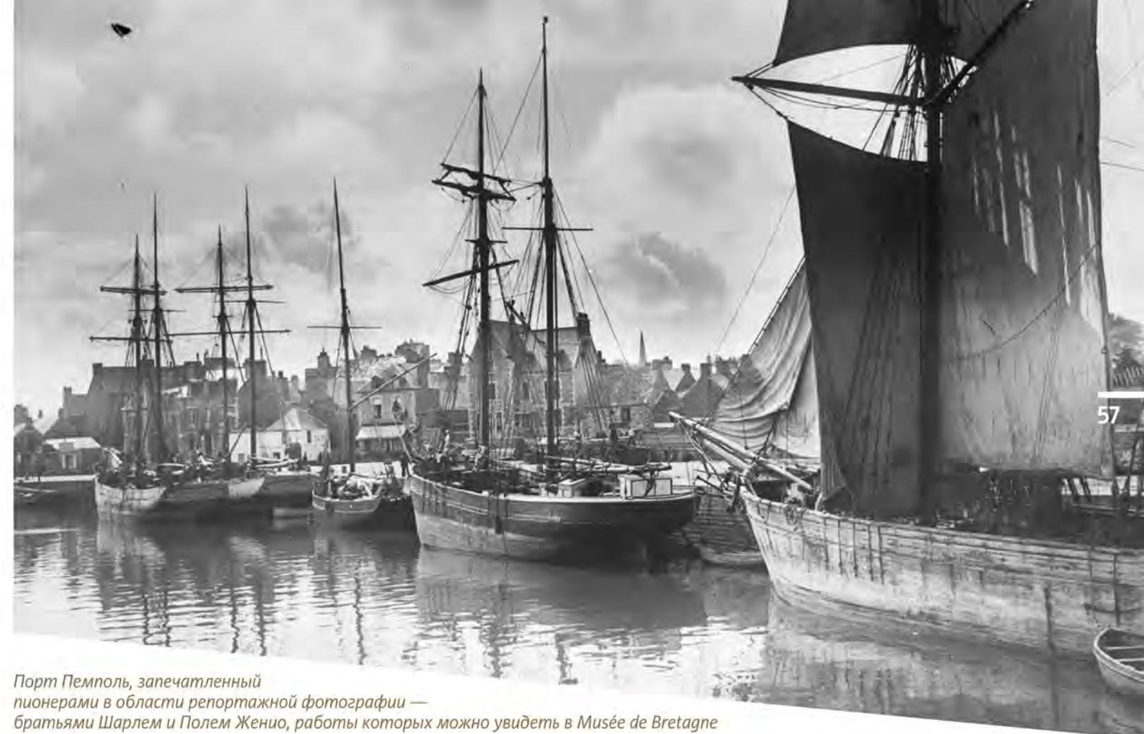
Порт Пемполь, запечатленный пионерами в области репортажной фотографии — братьями Шарлем и Полем Женио, работы которых можно увидеть в Musée de Bretagne

Самому старшему на борту шхуны — капитану — было не больше сорока, младшему — семнадцать, но он был не юнгой, а полноправным членом команды! Рыбачье ремесло передавалось от отца к сыну, а в море бретонские подростки ходили охотнее, чем в школу, где им запрещали говорить на родном языке — разрешали только по-французски. А если забылся и ляпнул что по-бретонски, то таскать тебе в наказание тяжелый деревянный башмак или камень с дыркой. А в море — свобода!